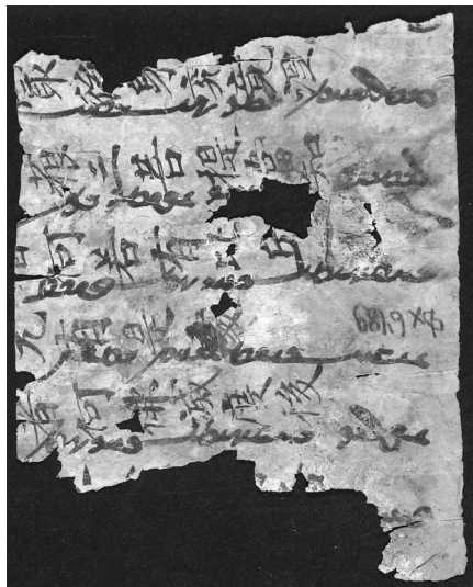
Ил. 2. Институт восточных рукописей РАН. Дуньхуанский фонд. Шифр ДХН 5966 Recto

Согдийские тексты записывали на обороте китайских свитков, как правило, манихеи — так что можно предположить, что и этот фрагмент происходит из манихейского монастыря. Как уже было отмечено, текст на оборотной стороне китайского свитка (на стороне Verso ) имеет помарки и подчистки, т.е. он исправлялся по ходу переписки.