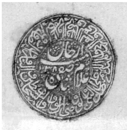
Ил. 1. Печать шаха Сафи I ( мухр-и хумайун ) Pl. 1. The Seal of Shah Safi I ( muhr-i humayun )