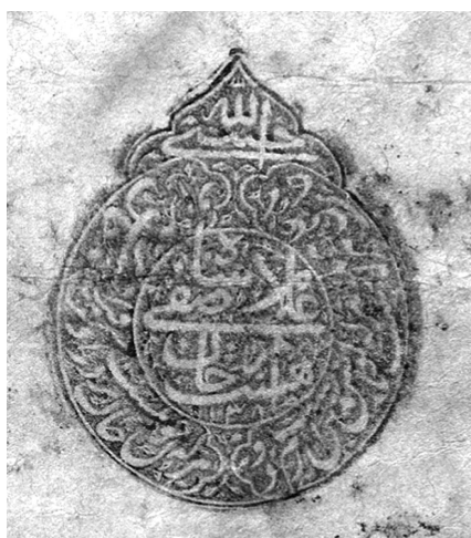
Ил. 2. Печать шаха Сафи I ( мухр-и шараф-и нафаз ) Pl. 2. The Seal of Shah Safi I ( muhr-i sharaf-i nafaz )

тискивалась на ракамах , «которые в раеподобном собрании пишут с нанесенной черными чернилами тугр ой «вынесено решение, подчиняющее себе мир ( хукм-и джахан-мута' шуд )» (ср. Приложение 3.5). В прямоугольных малых печатях легенда, как правило, содержит только имя и девиз правителя, а в мухрабе помещалась басмала.