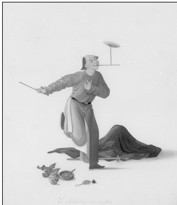
Ил. 4. Жонглер. ОР РНБ. Дорн 798. Л. 25. Juggler