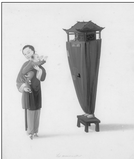
Ил. 3. Марионетки. ОР РНБ. Дорн 798. Л. 22. Marionettes