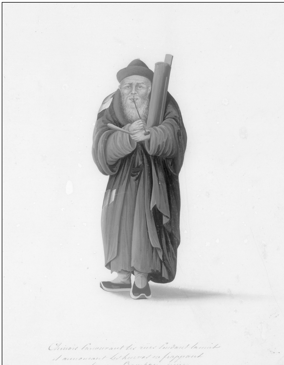
Ил. 1. Сторож. ОР РНБ. Дорн 798. Л. 45. Watchman