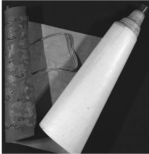
Рис. 1. Общий вид свитка. Шифр В 108 mss

Исследуемый диплом является одним из самых лучших по сохранности свитков из коллекции ИВР РАН.