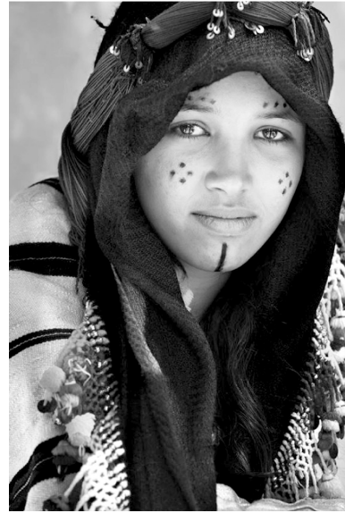
Девушка. Айт Хадду. Марокко.

Берберы убеждены, что определенные мотивы в оформлении татуировок, такие как кресты и другие узоры с заостренными элементами, являются магическими и защищают от сглаза. Вестермарк писал, что берберские женщины во многих регионах Магриба носили маленькие крестики, вытатуированные на кончике носа и на лице. Он, однако, полагает, что крестообразные элементы имеют более глубокое значение,