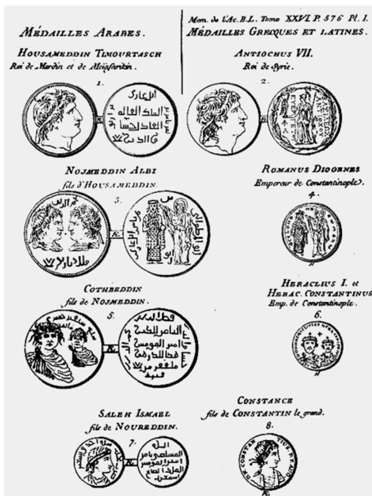
Ил. 1. Арабские и греко-латинские монеты (из кн.: Barthélemy 1759: 576, pl. I)

Я закончу, сведя все те факты, которые представлены в настоящем Сообщении, к двум очень простым предположениям. Всякий раз, когда мы встречаем портретные изображения на арабских монетах, можно быть уверенными, что их чеканили не для халифов и не для ортодоксальных мусульман. Всякий раз, когда мы встречаем на монетах портрет греческого царя или византийского императора, необходимо иметь в виду, что этот факт никоим образом не доказывает, что арабы знали этих правителей. Другими словами, когда какие-либо туркоманские правители хотели, чтобы их монеты были украшены портретными образами, то первые мастера монетной резьбы, которых привлекали к работе, не находили ничего лучшего, как скопировать образы греческих и латинских монет, которые случайным образом попадались им на глаза. Вот, если я не ошибаюсь, весь секрет изображений, которые мы встречаем на арабских монетах (Barthélemy 1759: 576) 6 .