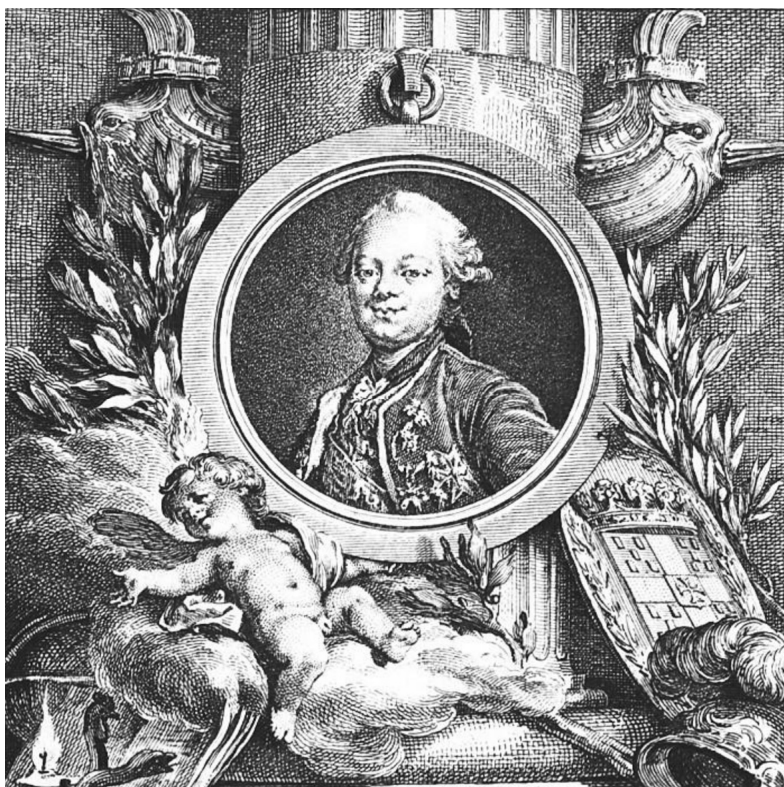
Ил. 3. Портрет герцога де Шуазеля (из кн.: Choiseul 1895)

Первым министром, «не по рангу, а по сути», известный адвокат называет графа Этьена-Франсуа де Стэнвиля, получившего в 1758 г. титул герцога де Шуазеля 32 , чей дом и семья станут почти родными для Бартеlemi ровно на сорок лет. Восхождение де Стэнвиля на Олимп французской политической власти было отнюдь не самым простым. Дворцовые интриги, любовные треугольники, монарший гнев и милость — всем этим полны мемуары министра, позволившего себе после опалы в декабре 1770 г. и ссылки в загородное имение Шантелу рассказать о своей жизни при дворе (Choiseul 1904) (Ил. 3).