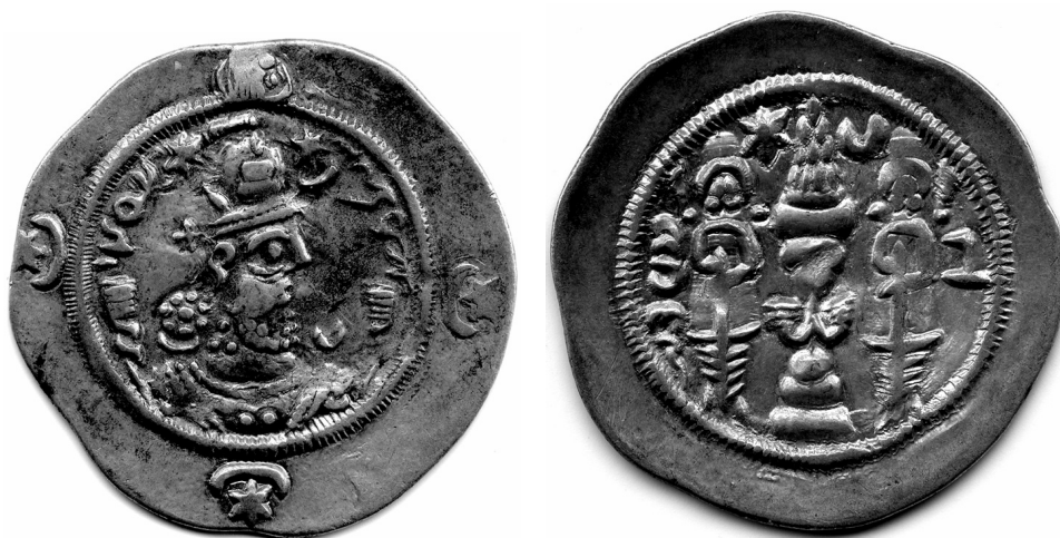
Рис. 5. Хормузд IV. 13 г. (591 н.э.), посмертная, мон. двор GW (Гурган), Государственный Эрмитаж, инв. 10285