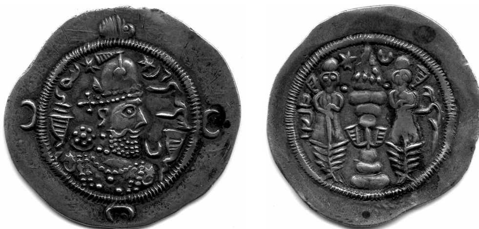
Рис. 8. Варахран VI. 2 г. (591 н.э.), мон. двор HLY (Герат), Государственный Эрмитаж, инв. 11702