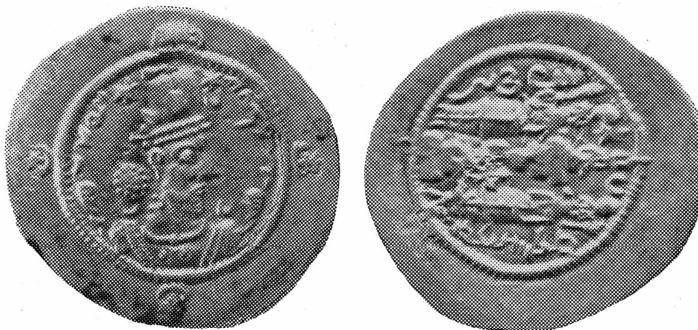
Рис. 4. Хормузд IV. 11 г. (589 н.э.), мон. двор MLWWNALT (Мервруд) Mochiri, 1977, Fig. 59