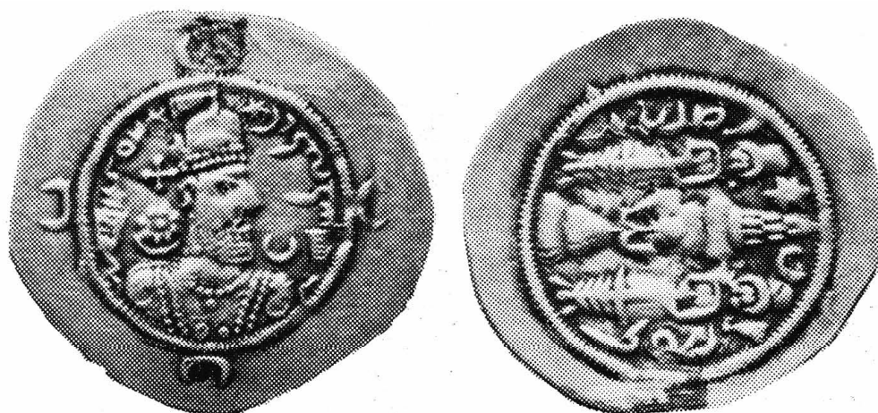
Рис. 9. Варахран VI. 2 г. (591 н.э.), мон. двор APL (Абаршахр), Mochiri, 1977, Fig. 60