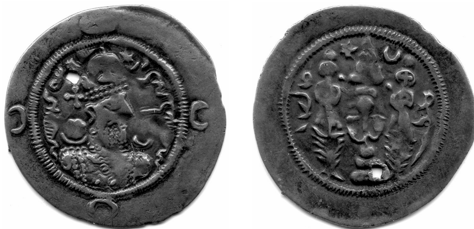
Рис. 7. Варахран VI. 2 г. (591 н.э.), мон. двор ML (Мерв), Государственный Эрмитаж, инв. 11701