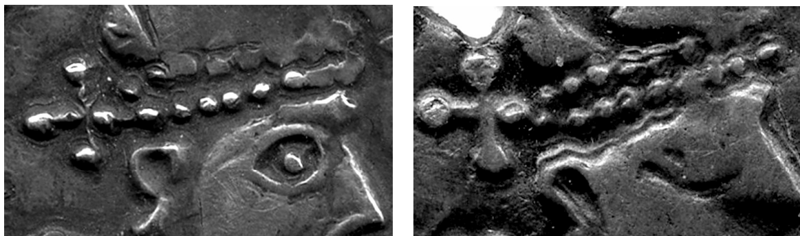
Рис. 2а,б. Крест за короной правителя