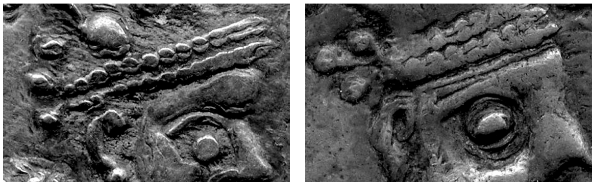
Рис. 1а,б. «Трилистник» за короной правителя