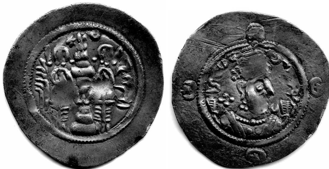
Рис. 3. Хормузд IV. 7 г. (585 н.э.), мон. двор WALWC (Грузия). Государственный Эрмитаж, инв. 10221